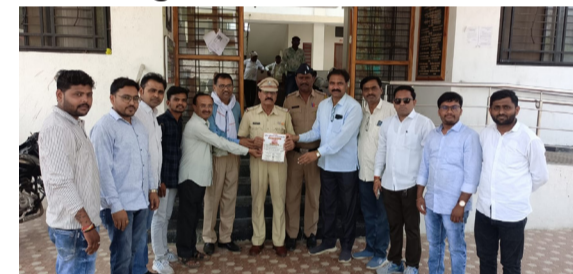
औषधी विक्री बंद करा ' ( GSR 817 दि २८ .० ८ . २०१८ मागे घेण्यात यावा ' कॉर्पोरेशन द्वारे व्यावसायिक डिस्कॉन्ट बंद करा , बनावट औषधी पासून देश वाचवा ' कोविड जीआर मागे घ्या अशा विविध मागण्या यामध्ये करण्यात आले असून ' त्यामुळे साखरखेडा

बुलढाणा : आपल्या विविध मागण्यासाठी ऑल इंडिया केमिस्टस असोसिएशनच्या वतीने भारतभरातील मेडिकल दुकाने बंद राहणार असून यामध्ये सिंदखेड राजा तालुक्यातील साखरखेडा येथील मेडिकल असोसिएशनच्या वतीने सुद्धा सहभाग नोंदवला असून 20 मे रोजी साखरखेडा येथील मेडिकल स्टोअर्स बंद राहणार आहे , याबाबत साखरखेडा पोलीस स्टेशनचे ठाणेदार यांना मेडिकल असोसिएशनच्या वतीने निवेदन देण्यात आले आहे ' ऑनलाइन